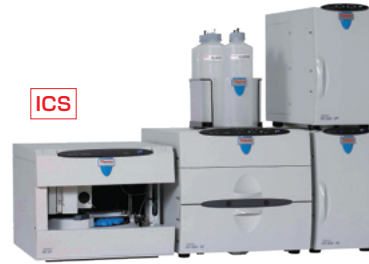
サーモフィッシャー (Thermo Fisher)