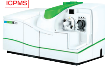
パーキンエルマー (Perkin Elmer)