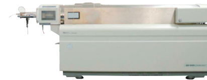
イービーサイエックス (AB SCIEX)